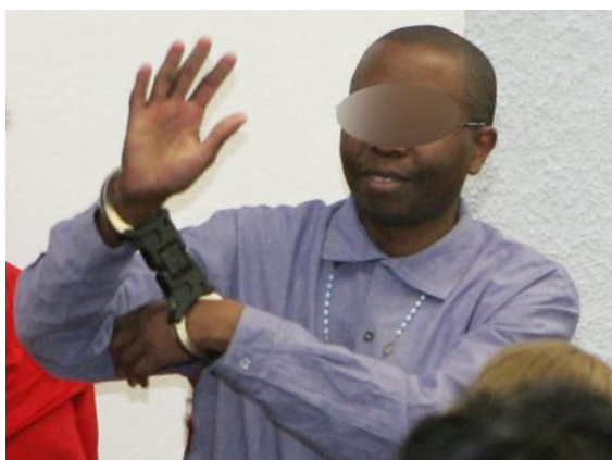
Ignace Murwanashyaka , Anführer der im Kongo kämpfenden Hutu-Miliz FDLR ("Demokratische Kräfte zur Befreiung Ruandas"), im Gerichtssaal des Stuttgarter Oberlandesgerichts.

Vor Gericht wurden E-Mails und SMS-Nachrichten verlesen, die Murwanashyaka über die Operationen im Kongo informierten. »Haben Dorf in Brand gesetzt«, heißt es beispielsweise in einer E-Mail vom 12. März 2009 - und dass es 65 Tote aufseiten des Feindes gegeben habe. »Wir grüßen Sie, Exzellenz«, steht in einer SMS an Murwanashyaka, mit der er am 17. Mai 2009 von den Einzelheiten eines Massakers in dem Dorf Busurungi erfuhr. Dort waren Ende April 2009 mindestens 96 Zivilisten brutal niedergemetzelt worden.