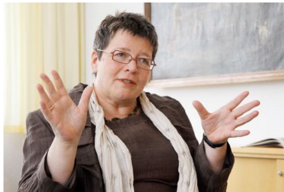
Ilse Junkermann, Bischöfin der Evangelischen Kirche in Mitteldeutschland

Die Bischöfin, die rund 850.000 Protestanten in Thüringen und Sachsen-Anhalt vertritt, verwies darauf, dass der Papst in Mitteldeutschland in eine Region mit einem sehr hohen Anteil von Atheisten komme. »Er trifft auf eine für ihn untypische Situation«, sagte Junkermann. »In dieser Region kommt es nicht nur darauf an, zwischen den Konfessionen ins Gespräch zu kommen, sondern auch mit den Nichtchristen.«