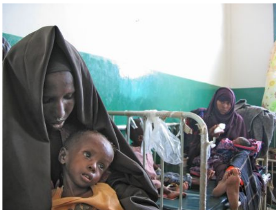
Mütter mit ihren unterernährten Kindern im Benadir-Krankenhaus in Somalias Hauptstadt Mogadischu.

Südhoff betonte, die Krise könne nur bewältigt werden, wenn die Produktion vor Ort ausgeweitet werde. Zudem müsse die Spekulation eingedämmt werden. »Denn eigentlich sind hohe Preise eine Chance für die Bauern.« Durch die starken Preisschwankung in Folge der Spe-