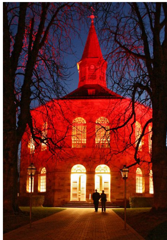
Die Bischmisheimer Schinkelkirche: die ideale evangelische Dorfkirche

Als Leiter der Oberbaudeputation war Schinkel dafür zuständig, fast alle staatlichen Bauvorhaben für das Königreich Preußen in ökonomischer, funktionaler und ästhetischer Hinsicht zu überprüfen. Als das Dorf Bischmisheim, damals preußisches Herrschaftsgebiet, in Berlin Zuschüsse für einen langschiffigen Kirchenbau beantragte, fand der eingereichte Plan bei Schinkel keine Zustimmung.